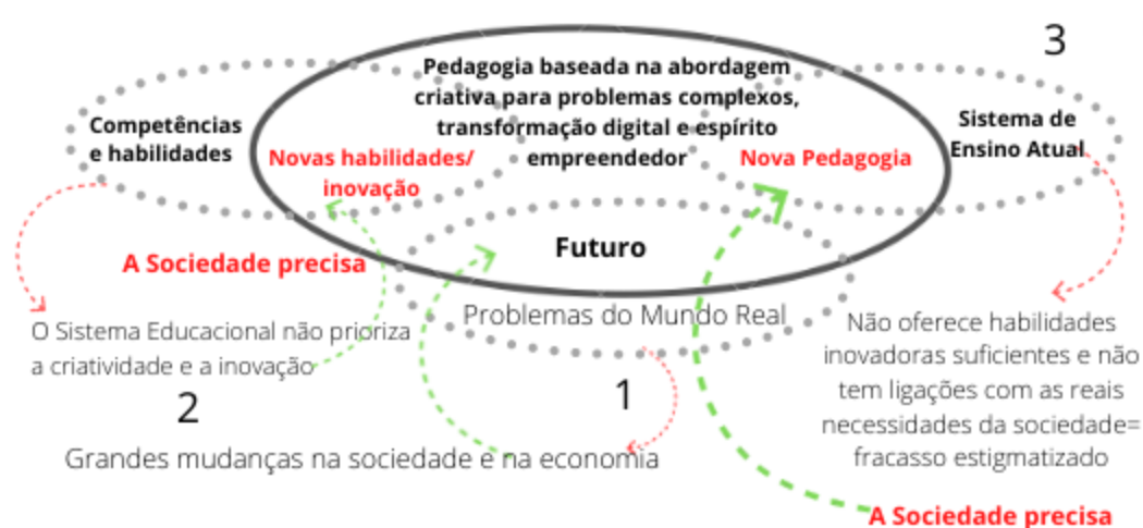
Quadro 1 - Necessidades Pedagógicas para o Futuro