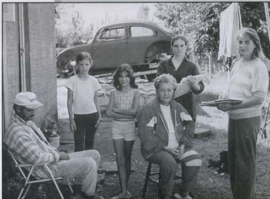
Entrevistas no ambiente familiar fazem parte do trabalho de campo

Além disso, o trabalho de campo abrangeu o ambiente escolar, com entrevistas de professores, orientadores, supervisores e outros agentes envolvidos no processo de ensino. No segundo momento, serão entrevistados alunos e pais.