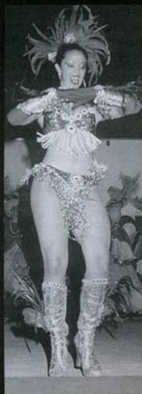
Escola de samba porto-alegrense animou o início do primeiro semestre letivo de 2001