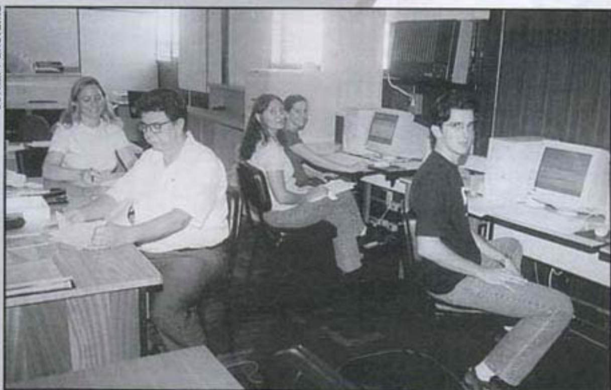
Sede do NEE funciona junto à extensão da Faccat no prédio do Banco do Brasil