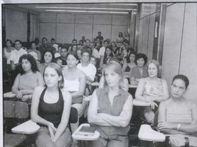
Participantes de 96 cursos ministrados em 22 municípios receberam seus diplomas