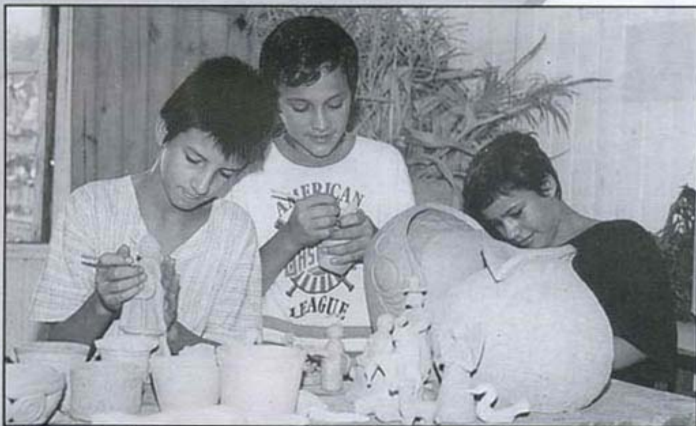
Ofícios profissionais, como a arte da cerâmica, são ensinados aos alunos internos

ENCONTROS TEMÁTICOS – Com o objetivo de instrumentalizar docentes para o emprego das novas metodologias de ensino, o Centro de Apoio à Educação Básica e a Faculdade de Educação lançaram, neste primeiro semestre de 2001, os Encontros Temáticos. O primeiro deles aconteceu em abril e versou sobre Língua Portuguesa. Em maio, o tema foi Arte, em junho será História e Geografia e em julho estará em foco a disciplina de Matemática.