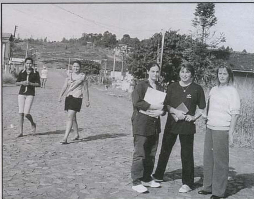
Bairro Santa Maria, em Taquara, é um dos abrangidos pela pesquisa

Através de visitas domiciliares, foram aplicadas entrevistas que abordaram desde fatores sócio-econômicos e culturais até valores familiares.