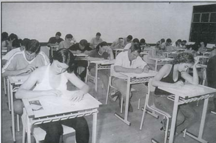
Concurso realizado em janeiro atraiu mais de 800 concorrentes

Quarenta e três por cento dos candidatos se situaram na faixa etária dos 17 aos 20 anos. Mesmo assim,