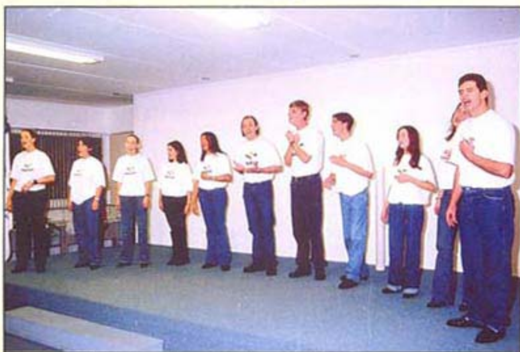
Grupo está sendo cada vez mais requisitado para apresentações