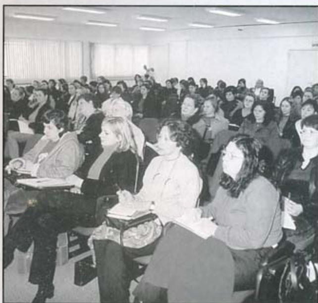
... no evento que reuniu professores de vários municípios