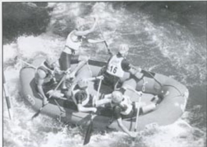
Esportes de aventura, como o rafting no Rio Paranhana, foram divulgados em evento de turismo no Rio de Janeiro