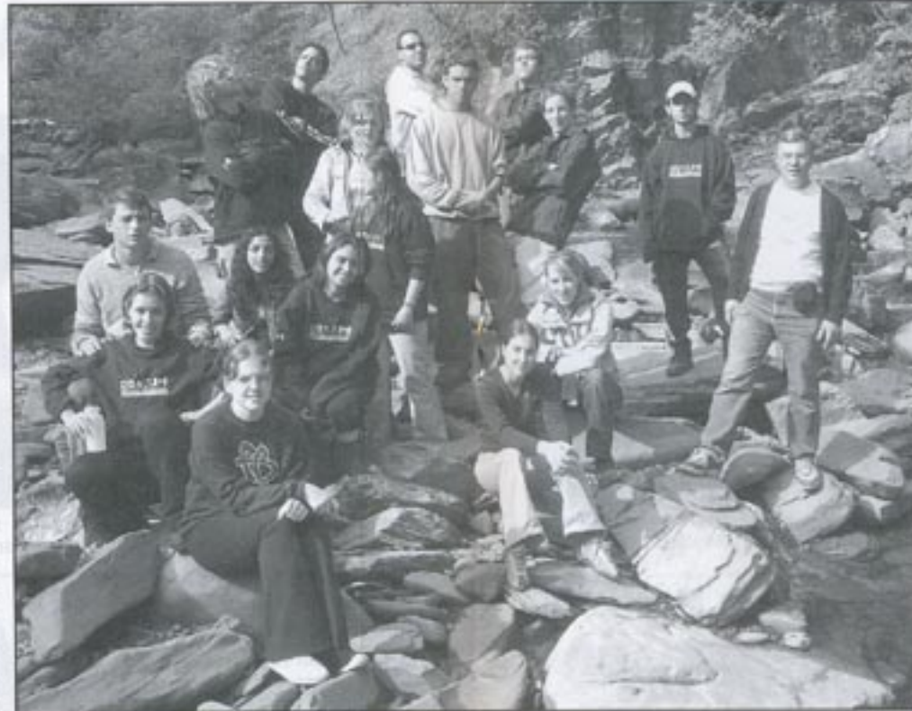
Novas formas de contato com a natureza sem perder de vista o desenvolvimento: uma dos tantos ensinamentos do intercâmbio

As atividades agrícolas que se desenvolvem na região são a criação de vacas leiteiras, a criação de gado para abate, a coleta e transformação dos produtos da