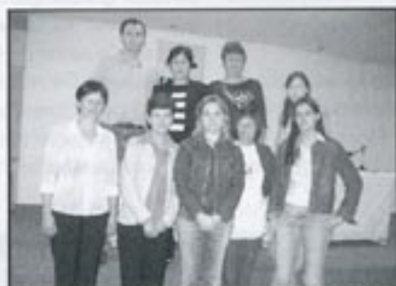
Vencedores do concurso promovido pelo Curso de Letras