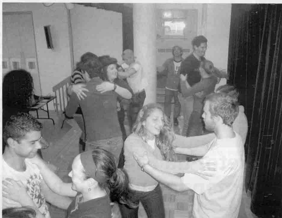
Integração cultural: participantes do intercâmbio em aula de danças folclóricas no Canadá

Além dos inúmeros grupos de dança e de música, aqui também acontece o maior festival do Quebec de música tradicional, o “Memoires e Racines” (Memórias e Raízes). Também existe um centro de registro e de pesquisa da tradição oral, que visa a registrar e guardar a tradição dos contadores de histórias, viajantes que iam de vila em vila, levando as novidades e, quase sempre, enfeitando as histórias até se tornarem lendas que permanecem vivas até hoje.