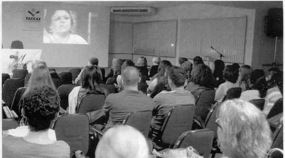
Documentário exibido na Semana da Educação retratou a situação das escolas brasileiras

Os dias 19 e 20 foram dedicados ao Seminário de Pesquisa “A imigração no Rio Grande do Sul – abordagens para uma história cultural”, com apresentação de pesquisas realizadas por alunos do Curso de História. Relataram os resultados de seus estudos