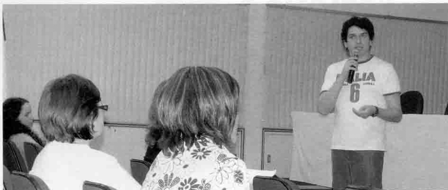
Acadêmicos da Faccat e de outras instituições apresentaram trabalhos na Mostra de Iniciação Científica

A exemplo do que já tinha acontecido em 2007, a mostra foi novamente aberta aos alunos de todos os cursos da Faccat, que, a exemplo dos colegas de outras faculdades e universidades, puderam apresentar trabalhos sobre as seguintes áreas de conhecimento: Exatas e da Terra (Matemática, Ciências da Computação, Sistemas de Informação), Engenharia (Engenharia de Produção), Sociais Aplicadas (Administração, Ciências Contábeis, Comércio Exterior, Marketing, Turis-