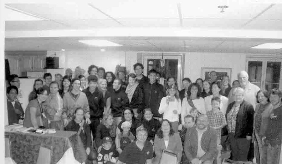
Hospitalidade: recepção calorosa na chegada dos acadêmicos da Faccat e seus colegas canadenses a Joliette

A vida em família, um dos componentes educativos do intercâmbio, é um ponto alto deste projeto, pois cada um acha que a família em que está hospedado, é a melhor. A grande maioria delas trata os participantes como filhos de verdade e faz com que nos sintamos em casa.”