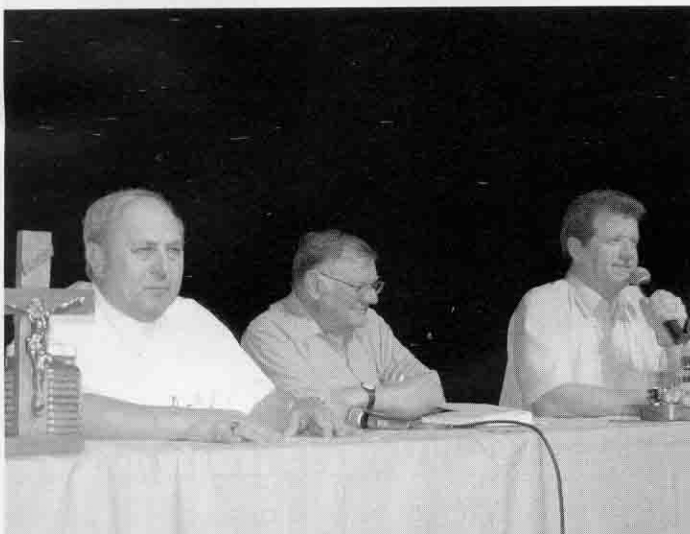
Arcebispo de Porto Velho (ao centro) com o bispo de Novo Hamburgo e o diretor da Faccat na Semana Teológica

Com o tema "Martírio, Testemunho e Beatificação na História da Igreja", aconteceu, de 10 a 13 de setembro, a 10ª Semana Teológica promovida pelas Faculdades de Taquara, Diocese de Novo Hamburgo e Prefeitura de Sapiranga. A programação transcorreu no Centro Municipal de Cultura Lúcio Fleck, em Sapiranga, reunindo centenas de participantes.