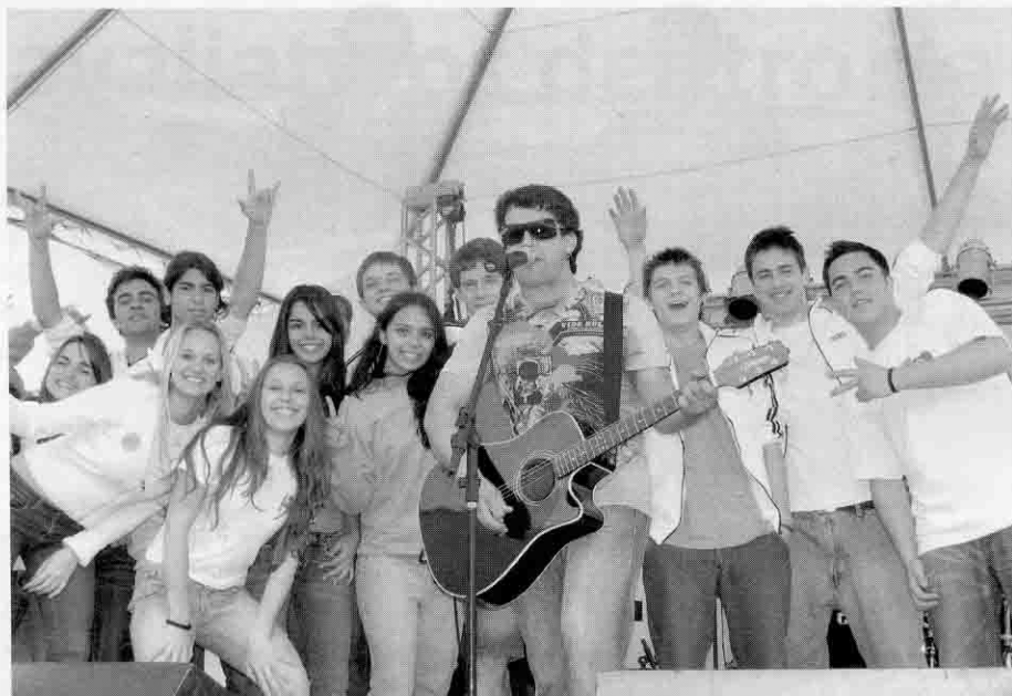
Visitantes foram recebidos com um programa descontraído e informativo