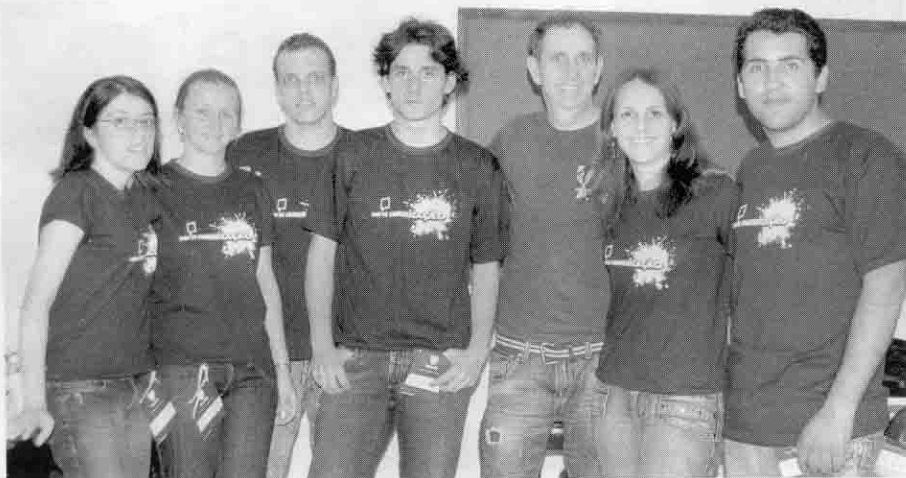
Alunos de Comunicação Social participaram de competição em Novo Hamburgo