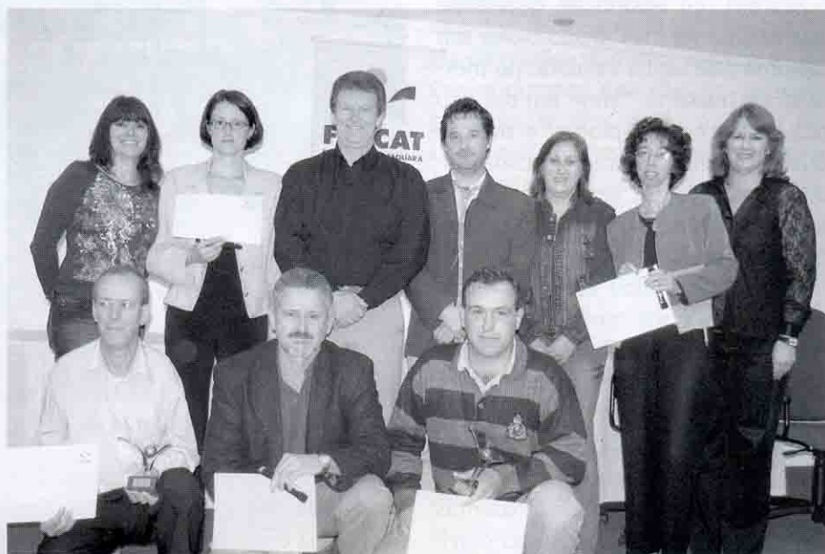
Vencedores com representantes da Faccat na solenidade de premiação