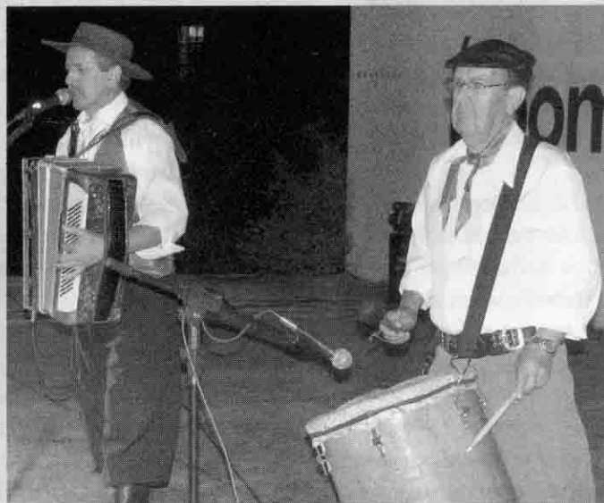
Apresentações artísticas no palco aberto fizeram parte da programação do Faccatchê

Houve, ainda, feira de artesanato e de produtos típicos gaúchos, venda de produtos coloniais, recanto cultural e o tradicional pão campeiro, que novamente se constituiu numa atração gastronômica à parte.