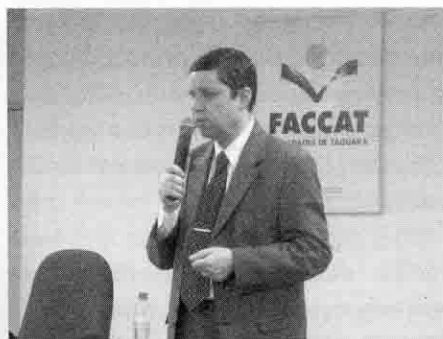
...juntamente com gerente estadual do Banco do Brasil