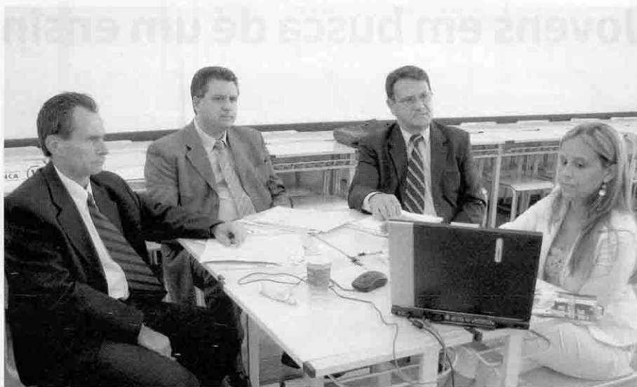
Julgamento dos Trabalhos de Conclusão é um dos rituais de final de ano

A formatura dos novos pedagogos está programada para o dia 15 do próximo mês, enquanto os concluintes de Administração e Ciências Contábeis receberão seus diplomas no dia 22.