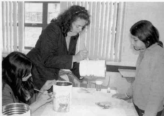
Reaproveitamento de materiais é ensinado na oficina de educação ambiental