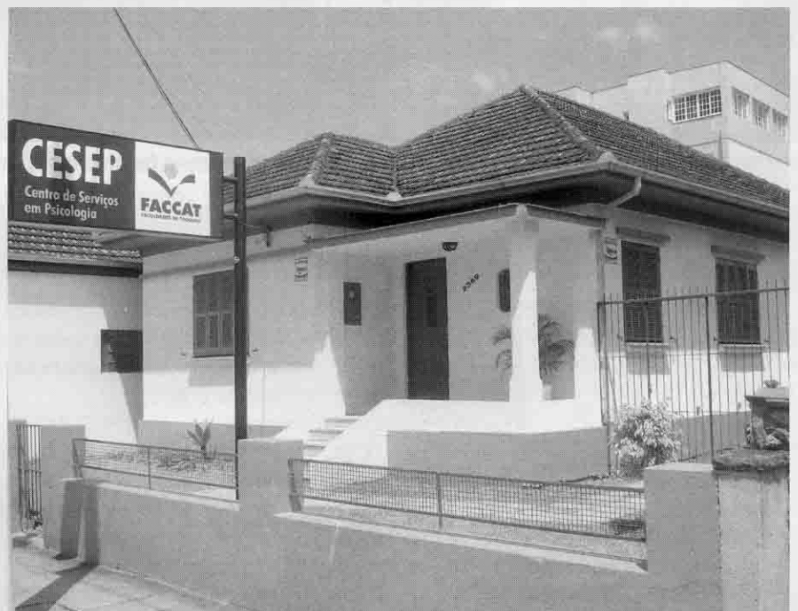
Clínica psicoterápica terá atendimento de estagiários de Psicologia e pode ser utilizada pela população em geral

Uma das propostas do Cesep é formar grupos homogêneos a partir da identificação de características comuns entre os pacientes, o que possibilitará o emprego de estratégias de trabalho coletivas para a resolução dos problemas que forem sendo detectados.