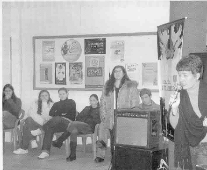
Saraus da Comunicação foram lançados em maio e ganharam edições mensais no segundo semestre