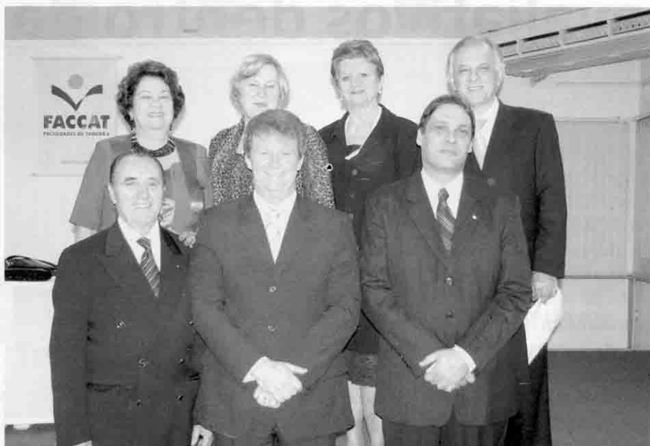
Diretor geral (ao centro) com os vice-diretores e membros da Feein

REALIZAR SONHOS - No ato de posse, o diretor geral destacou a importância da Faccat para a região. "São centenas de profissionais que foram preparados ao longo de todo esse tempo para atuar nas empresas, escolas e órgãos públicos, sendo abraçados pela comunidade regio-