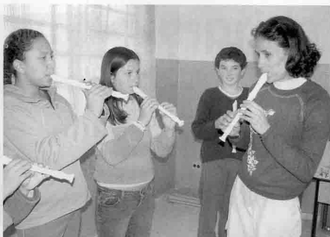
Oficina de flauta encontrou boa receptividade na criançada