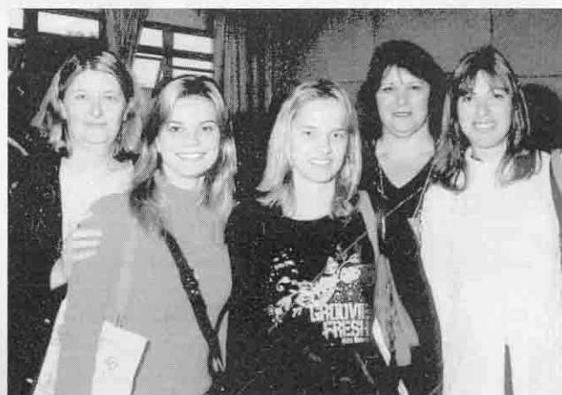
Professoras da Faccat presentes no 4º Siget - Simpósio Internacional de Estudos de Gêneros Textuais

Comuniquem-se conosco horizontes@faccat.br