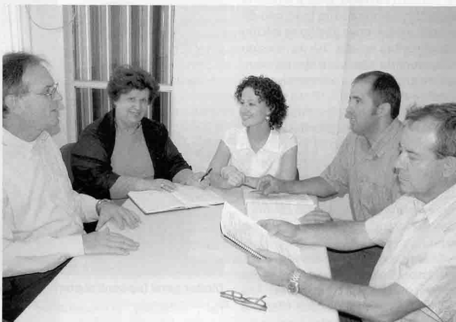
Membros da Comissão da Própria de Avaliação representam segmentos internos da Faccat e da sociedade organizada