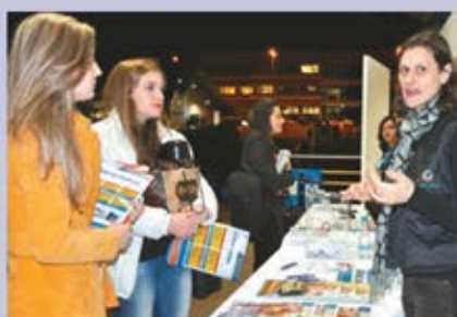
Evento mostrou possibilidades para quem quer se aperfeiçoar no exterior