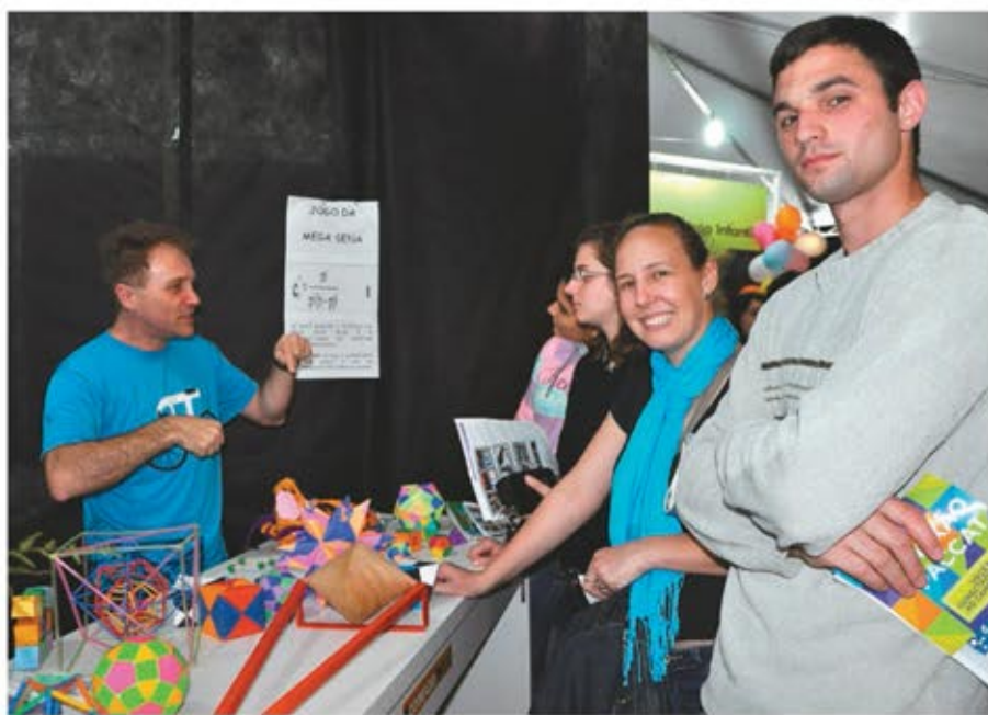
Na feira de cursos, a possibilidade de obter informações sobre diferentes áreas