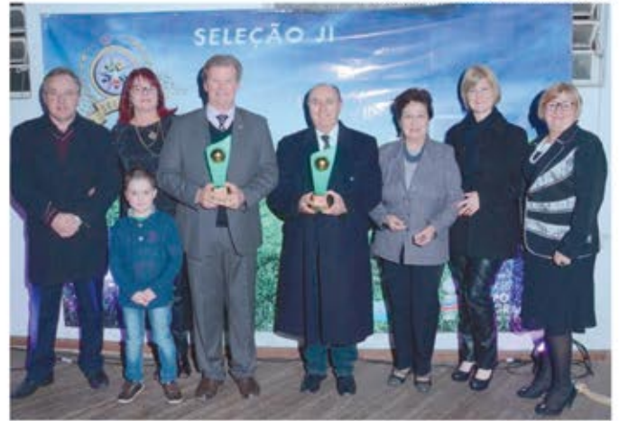
Instituição de ensino também foi homenageada em Parobé