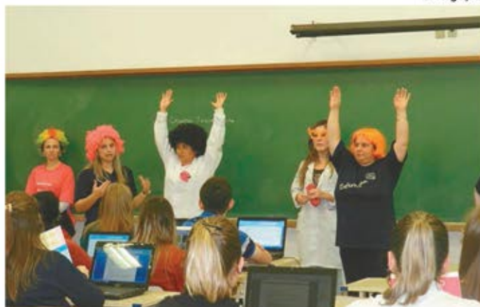
Outubro Rosa teve atividades nas salas de aula da Faccat