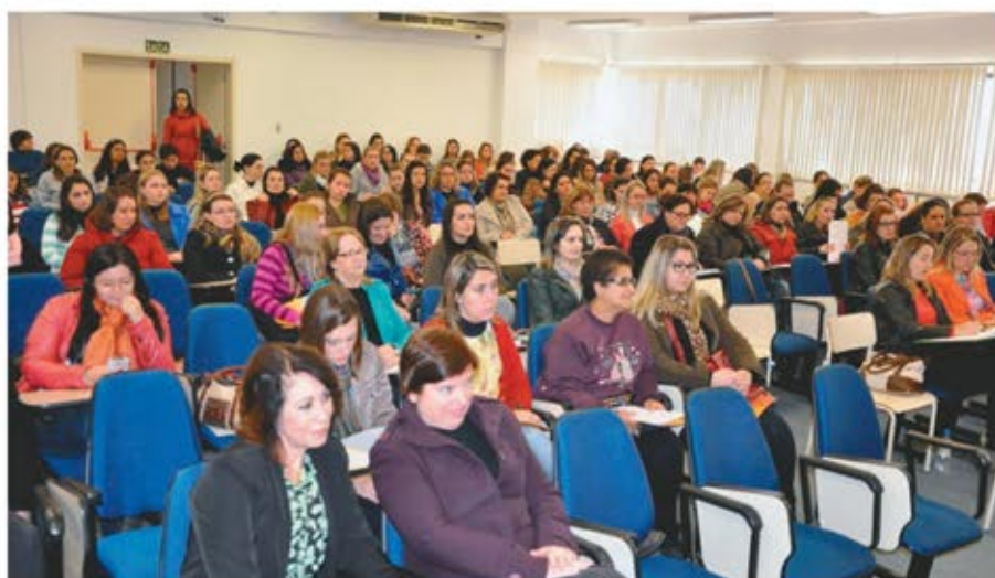
Seminário de Educação Infantil teve sua décima quinta edição neste ano

O seminário contou com oficinas focadas em diferentes áreas da Educação Infantil, como música e contação de histórias.