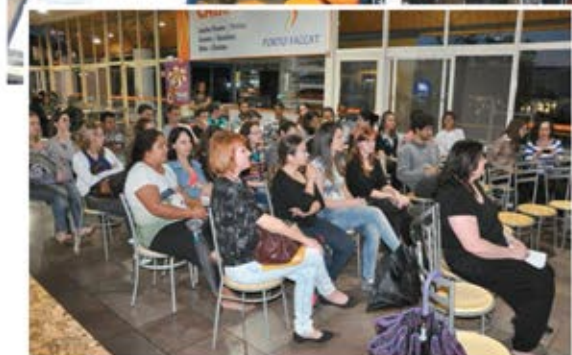
Evento realizado no Porto Faccat deve ter novas edições em 2015