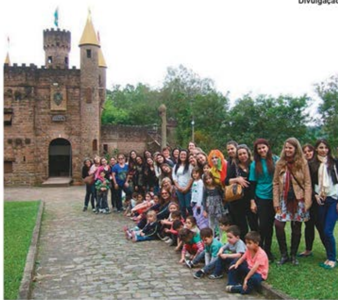
Acadêmicas do Pibid observaram atividade em Montenegro