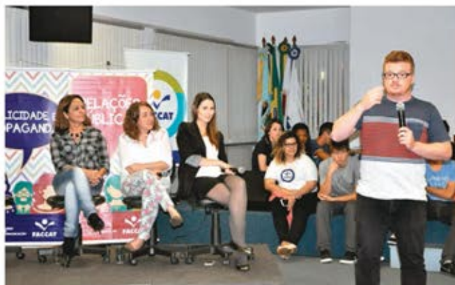
Ex-alunos falaram de suas experiências profissionais