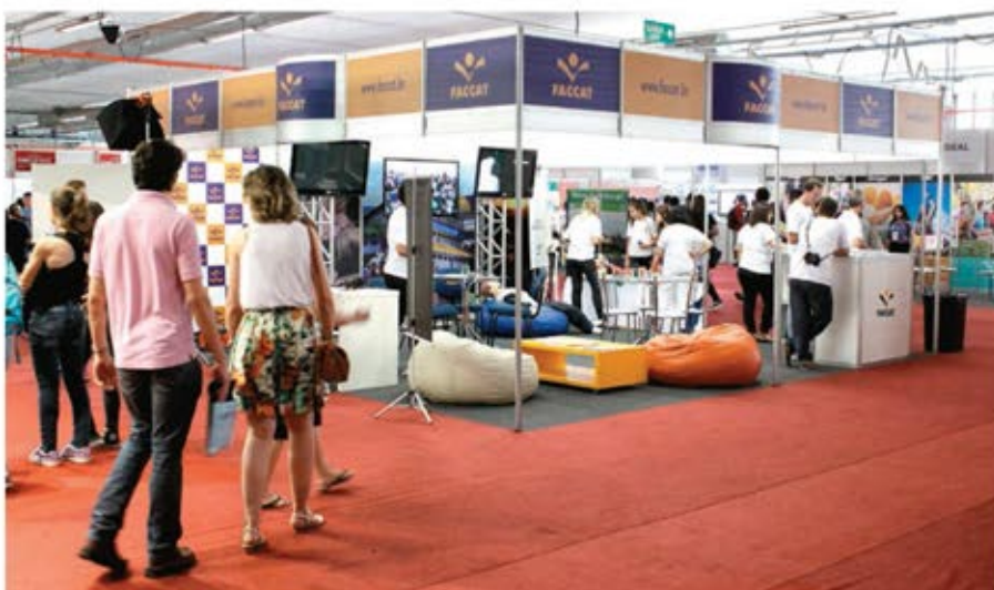
Estande da Faccat chamou à atenção na 29ª Mostratec, em Novo Hamburgo