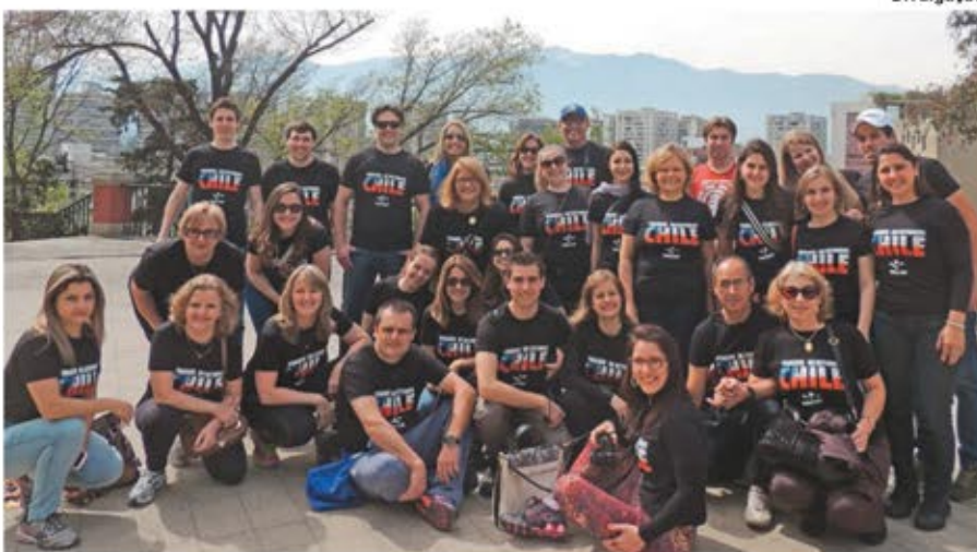
Grupo foi composto por alunos da graduação e pós, professores e convidados

O grupo, inicialmente, realizou um tour panorâmico na capital Santiago,