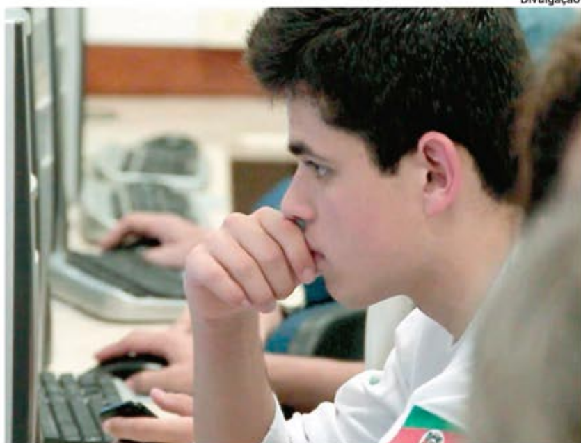
Alunos debatem temas de seu interesse com os professores na rede