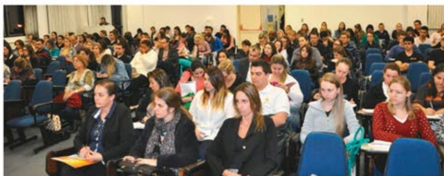
Pesquisadores da Faccat e de outras instituições prestigiaram programação