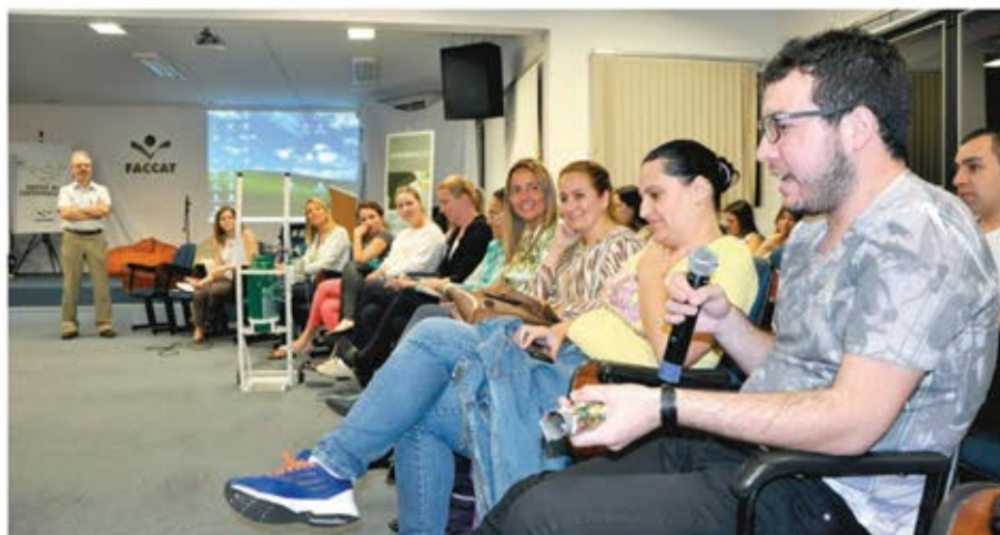
Acadêmicos de três graduações apresentaram trabalhos e debateram o tema