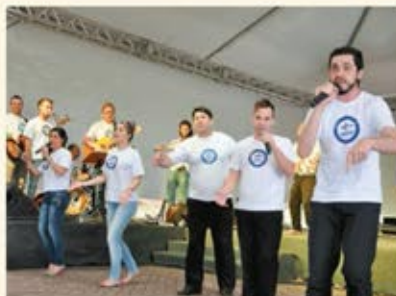
Mensagens animadas no palco