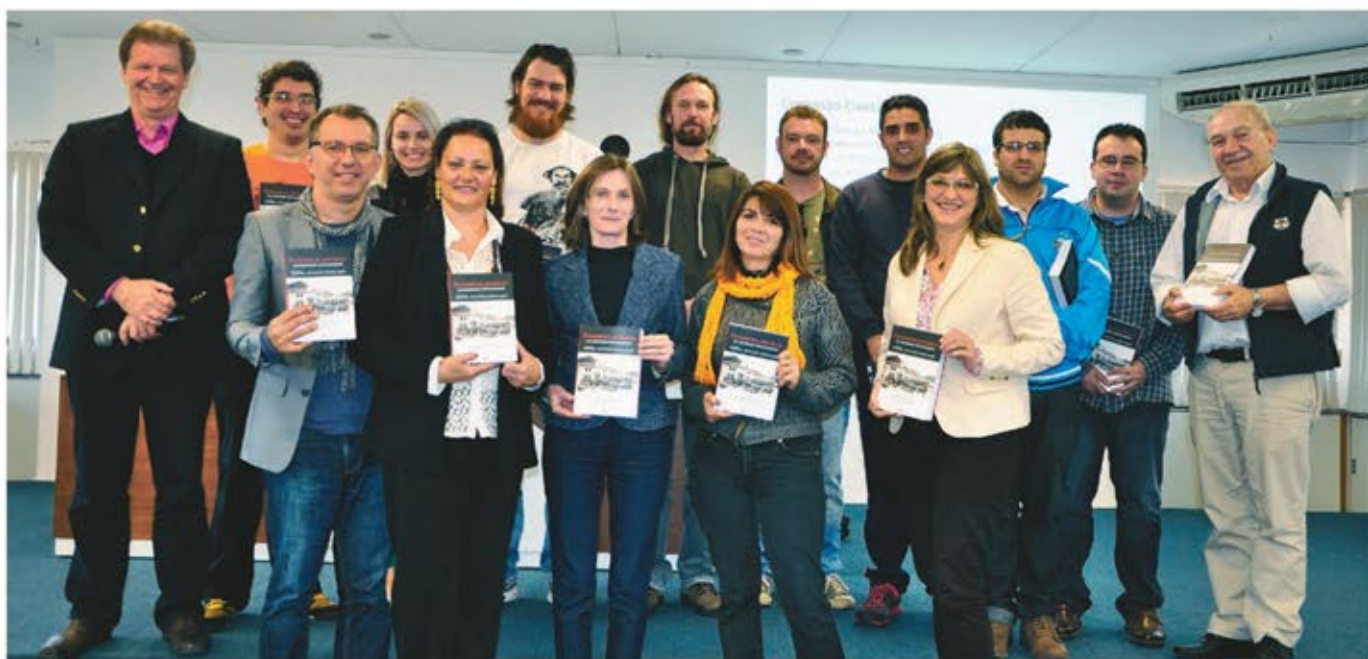
Lançamento de livro foi destaque na programação do evento organizado pelo Curso de História