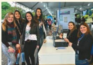
Suporte para inscrição no vestibular