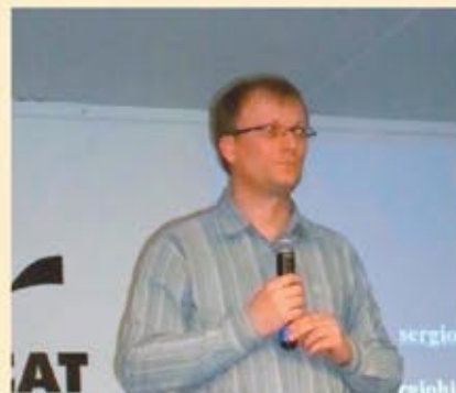
Sérgio: sistema para rodeio crioulo