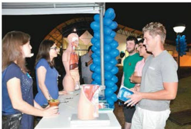
Chimarrão com Saúde integrou campanha Novembro Azul