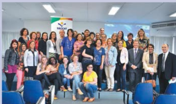
FDRH e Faccat encerraram curso de extensão em novembro