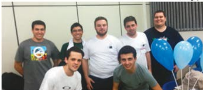
Estudantes participaram de evento promovido pela Sociedade Brasileira de Computação