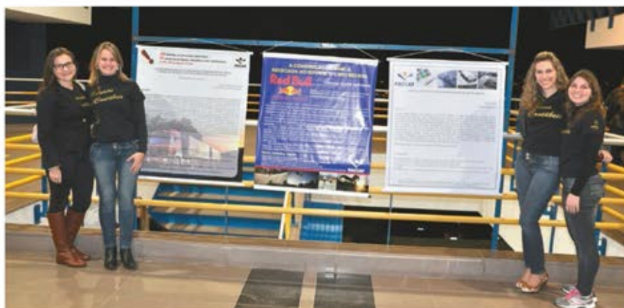
Pôsteres foram uma das formas de apresentação de trabalhos

O vice-diretor ponderou que, além do aprendizado e do crescimento acadêmico resultantes da experiência de apresentar uma pesquisa em evento, a participação na Mostra ou no Salão enseja outros ganhos aos participantes. “Conta como atividade complementar e também possibilita que o aluno possa aperfeiçoar a própria pesquisa que está desenvolvendo, a partir da interação com colegas e professores, melhorando o resultado final”, enfatizou.