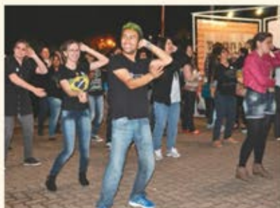
Flash mob do Curso de História