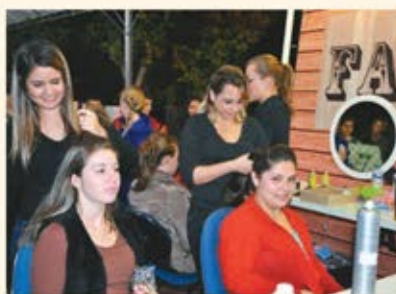
Pausa para arrumar o cabelo