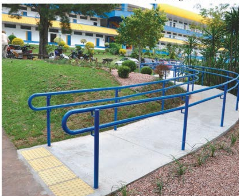
Rampas com corrimões visam a facilitar locomoção de cadeirantes

Em 2013, a Faccat já havia instalado um elevador no prédio administrativo para facilitar o acesso ao auditório e aos demais setores que funcionam no local. Com vistas à inclusão, a instituição também contratou uma intérprete da Língua Brasileira de Sinais (Libras) para acompanhar alunos portadores de deficiência auditiva nas atividades em sala de aula.