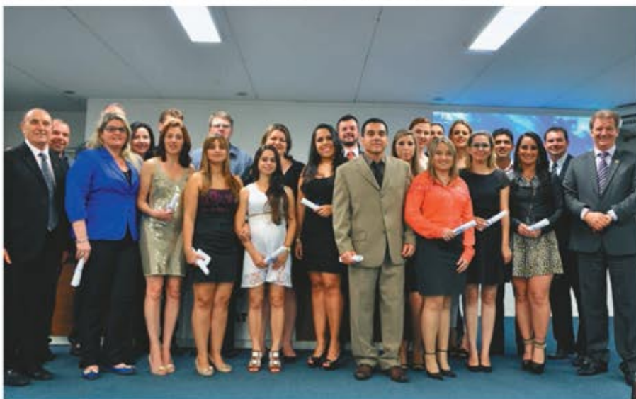
Grupo de pós-graduados com professores e membros da direção da Faccat

de conclusão de curso em suas respectivas áreas: