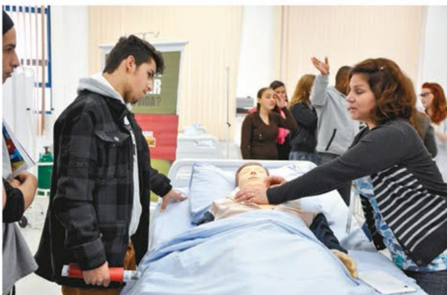
Visitas aos laboratórios, como o de Enfermagem, foram bastante concorridas

Recepcionados com alegria e descontração, os jovens tomaram a rua coberta instalada no campus nos dias 30 de setembro e 1º de outubro. Uma feira de cursos disponibilizou informações sobre todas as opções de graduação oferecidas pela Faccat. As coordenações dos Cursos aproveitaram para divulgar seus projetos e eventos, além de promover atividades interativas com os visitantes. Estes também puderam sentir a real possibilidade de fazer um curso superior, mesmo diante das dificuldades financeiras, conhecendo as diversas opções de ajuda para concreti-