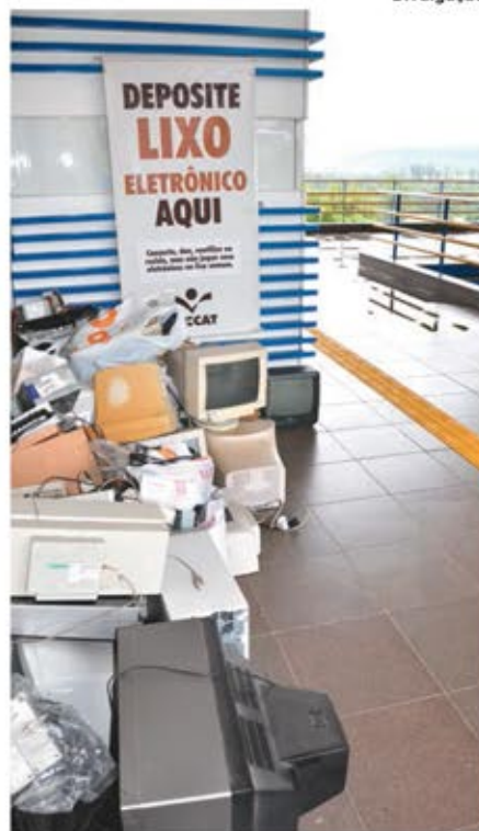
Depósito da campanha está no saguão dos blocos B e C