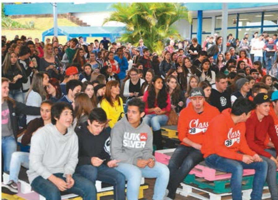
Mais de 3 mil concluintes do Ensino Médio vieram conhecer a Faccat