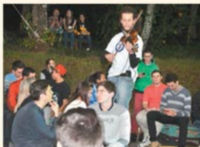
Música contagiando o ambiente