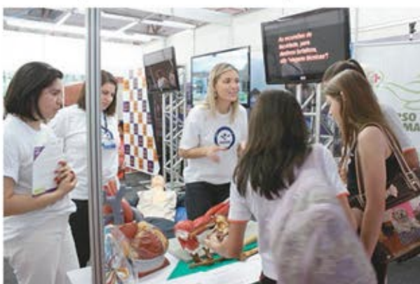
Curso de Enfermagem propôs uma das atividades interativas no espaço

Como já é tradição, o projeto vencedor da Mostratec foi contemplado com o Prêmio Inovação Tecnológica Faccat, que equivale a uma bolsa de estudos integral nos Cursos de Engenharia ou Sistemas.