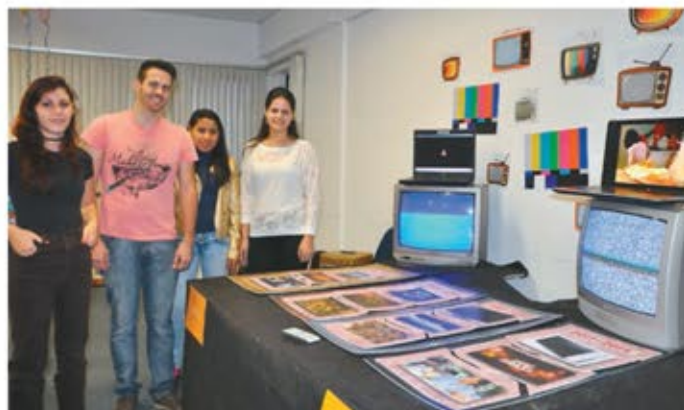
Atuais acadêmicos apresentaram exposição alusiva ao marco