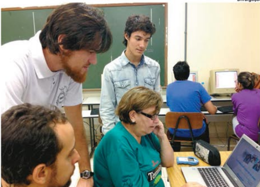
Plataforma digital desenvolvida pelo Polo de Inovação Tecnológica permite que conhecimento seja compartilhado nas escolas