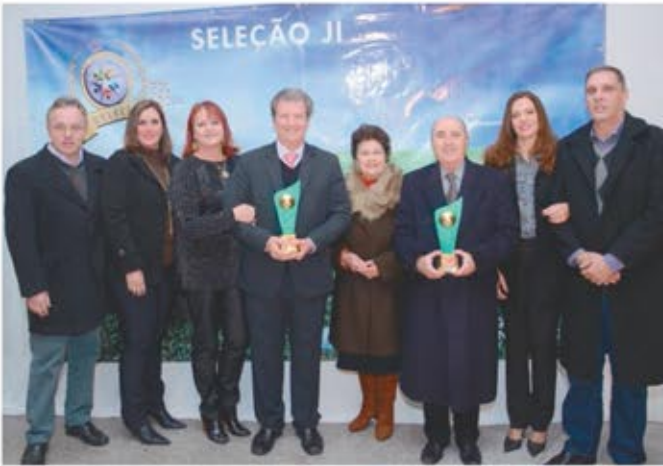
Representação da Faccat recebendo premiação em Igrejinha