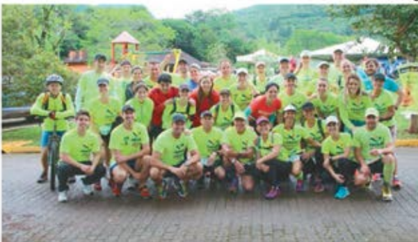
Equipe Faccat/Energia Vital no Parque das Laranjeiras