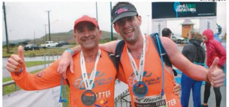
Atletas da Santa Ad Movere/Ritter/Faccat na Serra do Rio do Rastro