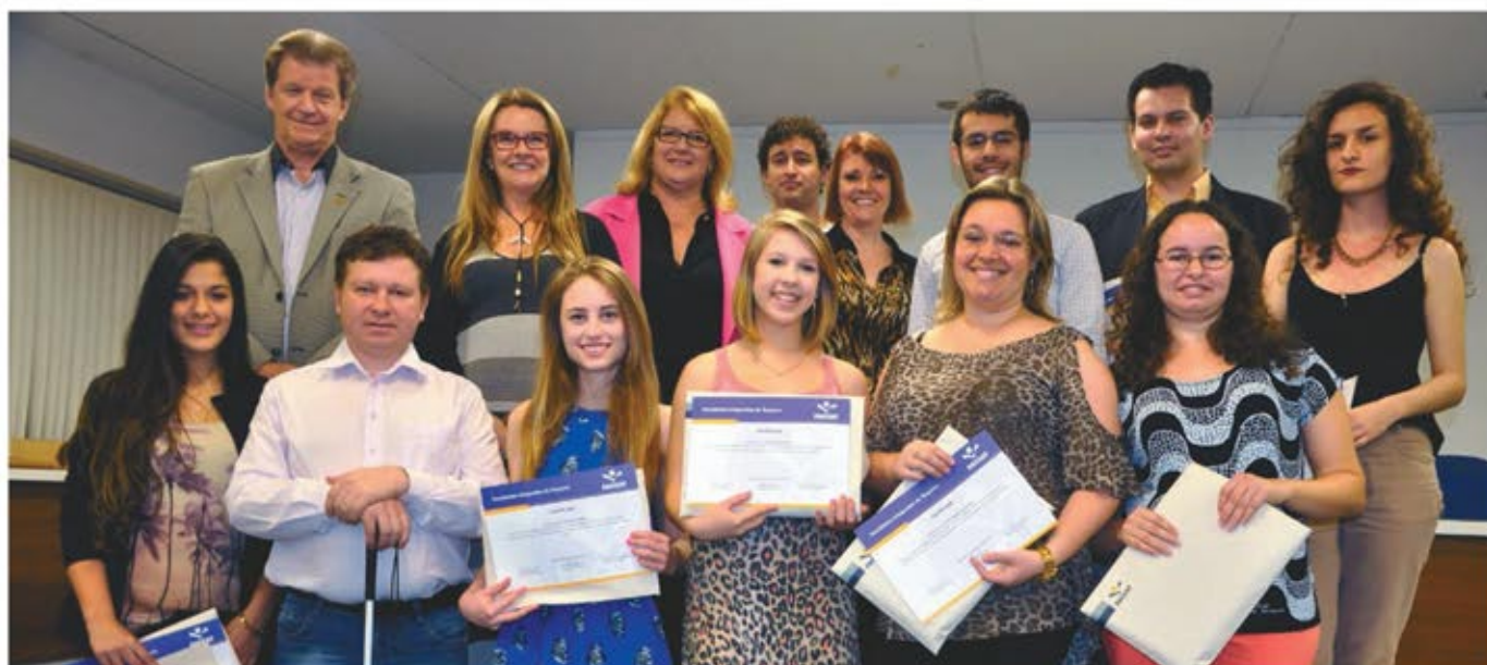
Representantes da Faccat e do Jornal Panorama com os vencedores da promoção na entrega dos prêmios